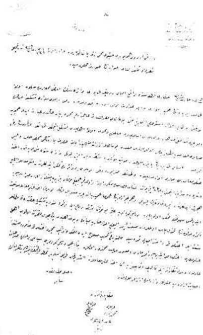
Zeki Paşa'nın Hamidiye Alayları'na katılmak isteyen Yezidi ve Alevi aşiretler hakkındaki değerlendirmesi 19 Mart 1307 (31 Mart 1891) Y. MTV 61/18

Kağıt üstünde amacı Kürt aşiretlerini disiplin ve kontrol altına almak olan bu uygulama söz konusu aşiretlerin mülki idarenin kontrolünden iyice çıkmasıyla sonuçlanmıştı. Bazı aşiret reisleri kendilerine verilen bu imtiyazları yerel halk üzerindeki kontrol ve baskılarını arttırmak ya da Hamidiye Alaylarına mensup olmayan rakip aşiretleri bastırmak için kullanma yoluna gitmişlerdi (Duguid, 1973: 147. Fırat: 1948: 125-126). Yerel mülki idarecilerin Hamidiye Alaylarının başındaki aşiret reislerinden