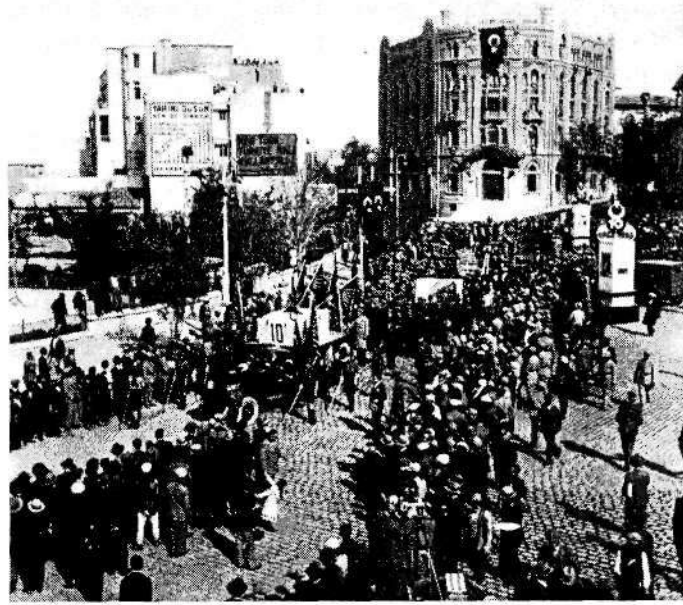
©Meçhul Seyyah(lar)ın Ankara Fotoğrafları (Frank Fokke Ferwarda Arşivi) © Kebikeç