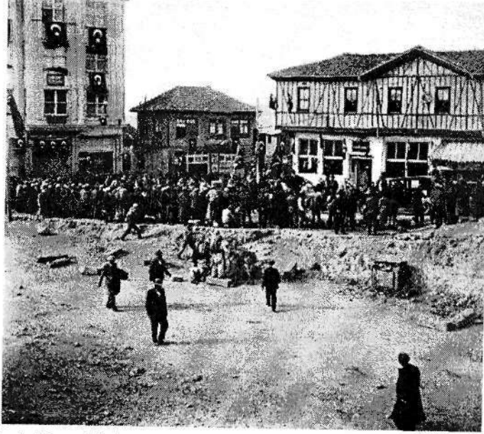
©Meçhul Seyyah(lar)ın Ankara Fotoğrafları (Frank Fokke Ferwarda Arşivi) © Kebikeç