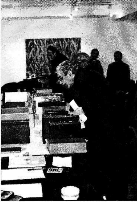
'Tozlu Rafların Şövalyesi' 2. Ankara Antika Kitap Müzayesi esnasında, kitapları esaslı bir muayeneden geçirirken, 26 Ocak 1997