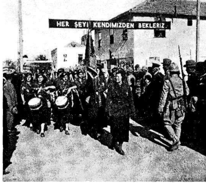
©Meçhul Seyyah(lar)ın Ankara Fotoğrafları (Frank Fokke Ferwarda Arşivi) © Kebikeç