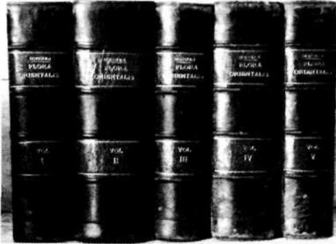
Boissier'in Flora Orientalis'i

evvel ülkemizde yapılan floristik toplamalar, ülkemiz Florasının yazılmasına son derecede katkı sağlamıştır. En azından o zamanlar bulunan ve zamanına göre yeni tür olan bitki örnekleri, ülkemiz endemiklerinin tip örneklerini oluşturmuşlardır. Biraz daha ayrıntı vermek gerekirse, ülkemizde yapılan ilk bilinçli floristik gezi saydığı Tournefort'un 1700 - 1702 tarihleri arasında Ağrı Dağı ve sonra Orta Anadolu'dan İzmir'e kadar yol boyunca yaptığı floristik çalışmalar sonucu yayınlanan, ayrıntıları A. Baytop'un 2003 yılında yayınladığı kitapta ve bu derginin bir evvelki sayısında anlatılan, ayrıca The Karaca Arboretum Magazine dergisinin 2003 yılı sayılarında tefrika edilmeye başlanan doğu seyahati ile Boissier'in yukarıda adı geçen eserinin yazılış periyodu olan 1867-1888 tarihleri arasındaki devre ile ondan sonraki yani 1900'lü yıllardan zamanımıza kadar olan devredir.