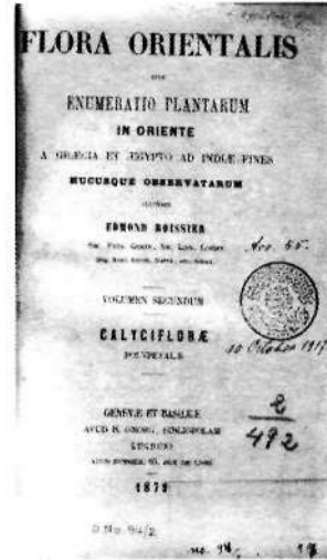
2. cilt, iç kapağı

Bu devrelerde ülkemizde floristik çalışmalar yapmış botanikçiler hakkında yukarıda söz edilen eserlerde, özellikle Asuman ve rahmetli T. Baytop tarafından yazılan kitaplarda, ayrıntılı bilgiler bulabilirsiniz. Ancak burada özellikle genç botanikçilerimize, o devrelerin bitki toplayıcılarının ortak bir özelliğinin altını çizmek isterim. O zamanlar bitki toplayanlar arasında şimdiki gibi tipik botanikçiler de olmakla birlikte, çoğu doğa bilimcidirler. Bitkilerle birlikte hayvan, hatta jeolojik materyal de toplamışlar ve bu materyalleri çok fazla müzeye dağıtmışlardır. Örneklerini daha çok Avrupa herbaryumlarına dağıtmış olan o zamanki toplayıcılardan bazılarının, örneğin