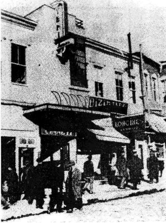
1930'lu yıllarda Ulus, Yeni Sinema girişi

de, işletmecilik anlayışında da en ufak bir eksilme olmamıştı. Genellikle üniversite öğrencilerinden ve okuz yazar takımından oluşan izleyicisiyle çizgisini koruyabilmişti. Talip Sineması'nın artık olmamasını, sinema izleyicileri adına gerçek bir kayıp kabul ediyorum. Bu sinemaların birer birer kapanmasından sonra bugün koskoca Tunalıhilmî de üçe bölünmüş tek bir sinema kaldığı görmek, insanı gerçekten üzüyor.