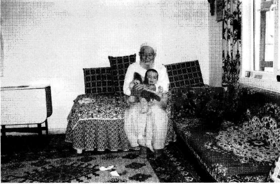
"Kaşları çatık, gözleri hilal / Nasılsın iyi misin torunum Bilal."