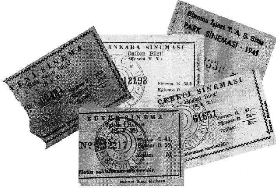
Ankara sinemalarına ait muhtelif bilet örnekleri

RINCA SİNEMASI (Küçük-esat), KEREM SİNEMASI (Yenişehir), KIZILIRMAK SİNEMASI (Yenişehir), KOÇ SİNEMASI (Maltepe), KORAY SİNEMASI (Kolej), KÖŞK SİNEMASI (Maltepe) LALE SİNEMASI (Yenişehir ve Kavaklıdere), MAMAK SİNEMASI (Mamak), MELEK SİNEMASI (Cebeci-Dörtüyl), MİNE SİNEMASI (Maltepe), NUR SİNEMASI (Dışkapı), ÖZER SİNEMASI (Maltepe), SARAY SİNEMASI (Hamamönü), SES SİNEMASI (Kavaklıdere), SEYRAN SİNEMASI (Yenimahalle), SİNEMA 70 (Yenişehir), SİTE SİNEMASI (Cebeci), STAD SİNEMASI (Ulus), SUN SİNEMASI (Cebeci), SÜREYYA SİNEMASI (Aydınlıkevler), TALİP SİNEMASI (Küçükesat), UZAY SİNEMASI (Dikimevi), YENİ ULUS SİNEMASI (Kavaklıdere), YILDIZ SİNEMASI (Kavaklıdere),