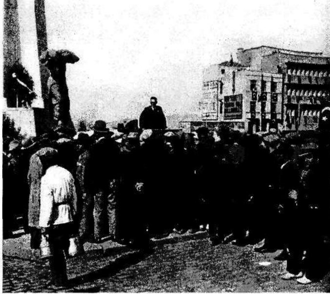
©Meçhul Seyyah(lar)ın Ankara Fotoğrafları (Frank Fokke Ferwarda Arşivi) © Kebikeç