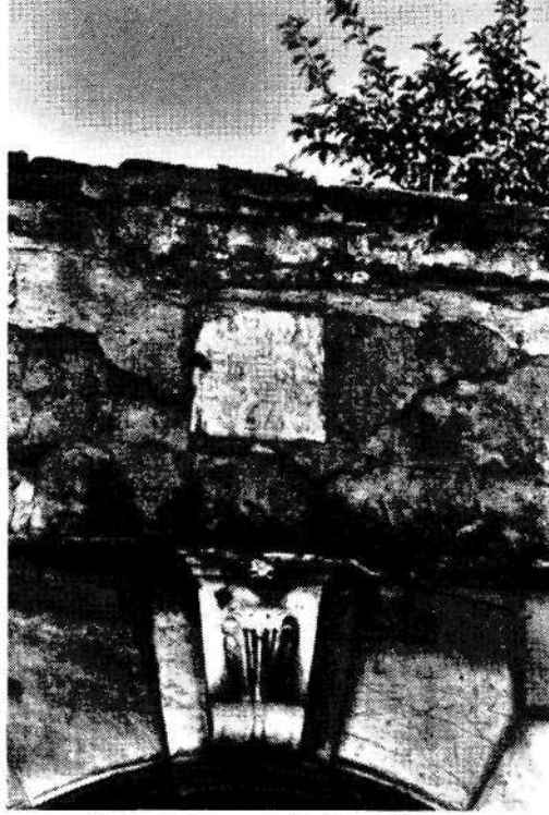
Milas'taki sinagogun giriş kapısından ayrıntı

okullarının mali imkanlarının üstünde olan bir bütçenin altında ezildiklerini ve cemaat mensuplarının kişisel fedakarlıklarda bulunup okullarda borç para vermeleri sayesinde öğretmen maaşlarının ödendiğini bildirmişlerdir. Yeni öğretim düzeyinde Türkçe öğretmenlerinin maaşları çok yüksekti. Bu maaşların azınlık cemaatleri tarafından ödenmesi zorunluluğu yüzünden Yahudi cemaati ciddi bir para sıkıntısıyla karşılaşmış ve birçok okul kapanmak zorunda kalmıştır 80 . Alliance, 1930'lara dek okullara para göndermeye ve okul müdürleri ile düzenli bir ilişki içerisinde olmaya devam etmiştir. Bu okullar hala Yahudi okullarıydı ve din eğitimi de verdikleri için (1936'ya dek) Alliance'ın gözünde önemlerini korumakta idiler. Ancak 1925'te öğretim dili olarak Türkçe'nin kullanılmaya başlamasıyla birlikte bu okulların Alliance'a bağlı kurumlar olma niteliği de sona ermiştir 81 . Milas Musevi Mektebi'nin kapanmasını bu nedenlerden başka, öğrenci sayısının azalmasını da ekleyebiliriz. Çünkü Milas Yahudilerinin çoğu İzmir, İstanbul gibi büyük şehirlere veya Avrupa ülkelerine göç etmeye başlamışlardı. 1927-1928 yıllarında yüzelli/yüzaltmış civarında öğrenci varken bu sayı daha sonraki yıllarda çok azalmıştı 82 . Genel olarak Türkleşmenin eğitime yansımalarıyla azınlık okullarının ve bu okullarda öğrenim gören öğrencilerin sayıları gitgide azalmıştır 83 . Bu durumda Milas'taki Musevi Mektebi, kızlar okulu binasıyla birleşmiş, tek bir okula dönüşmüştür 84 . Milas'taki Musevi Mektebi