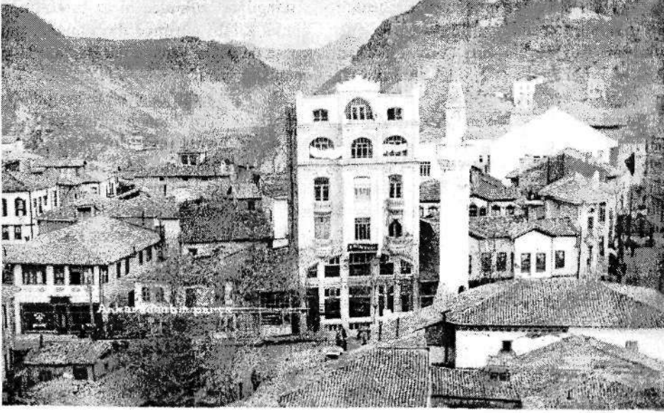
Foto-kart: 40'lı 50'li yıllar, Anafartalar civarı. Turgut Baba'nın tezgah açtığı sokaklar.