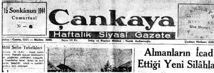
Çankaya Gazetesi'nde "Çankaya Kitabevi"nin reklamı