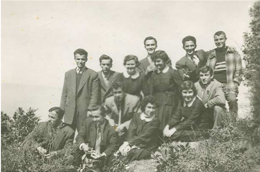
M. Çelikel Lisesi son sınıf öğrencilerinden bir grup öğle tatilinde